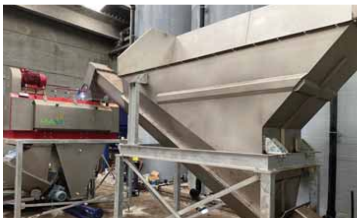
Paddle Depacker - Model S

S naším strojem produkujeme nejčistší organický výstup na trhu, u kterého můžeme zaručit čistotu 99,5 %. U některých instalací dosahujeme čistotu přes 99,9 %.