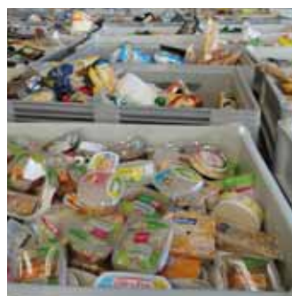
Vstupní materiál - netříděný odpad ze supermarketu