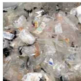
Výstupní materiál - vyříděný plast